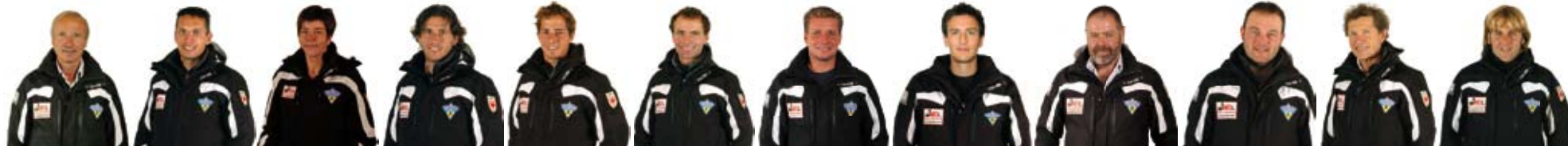
LODOVICO LUDWIG magDALena manFRED marco markUS mattI matTHIAS OSWALD OTTO C OTTO V RICHARD F